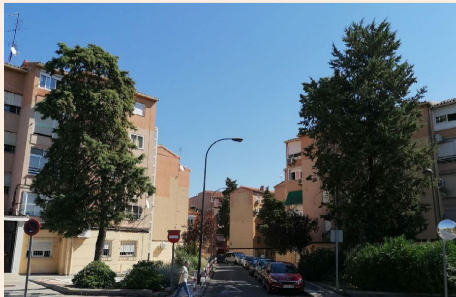
Árboles de Juan de la Cierva afectados por el proyecto de remodelación de la calle.