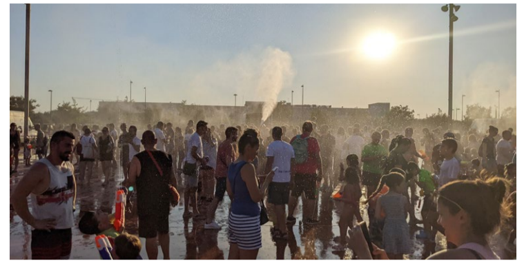
Las fiestas del barrio de Los Molinos, donde la edad media ronda los treinta años.

2.- Creación de una UFIL (Unidades de Formación e Inserción Laboral). Escuelas profesionales duales: conec-