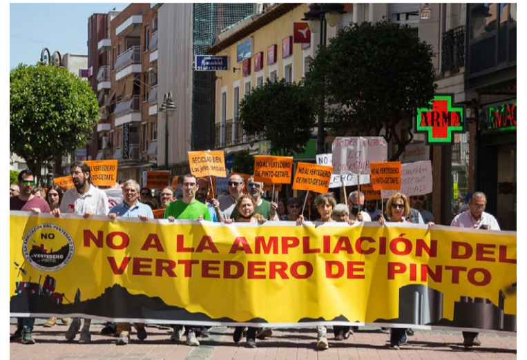
Manifestación contra la ampliación del vertedero de Pinto-Getafe.

Son algunos ejemplos de iniciativas de defensa de los ciclos de la naturaleza y su estrecha relación con la economía. La idea del crecimiento económico ilimitado choca frontalmente, con «el placer de vivir en armonía con el planeta tierra». Caminar en esta dirección, re-