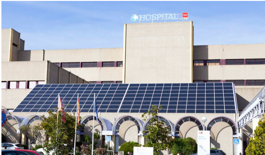
Hospital de Getafe

Fue en el año 2012, tras años de lucha para conquistar la universalidad en la atención sanitaria para toda la población en el territorio español, independientemente de su situación jurídica, cuando el Gobierno de España presidido por Mariano Rajoy borró de un plumazo esta universalidad a través del Real Decreto 16/2012. Con esta ley, la prestación sanitaria quedó limitada a la asistencia en caso de urgencia por enfermedad grave o accidente hasta la situación de alta médica y a la asistencia durante el embarazo, parto y posparto, así como la atención a enfermedades infectocontagiosas y enfermedades mentales.