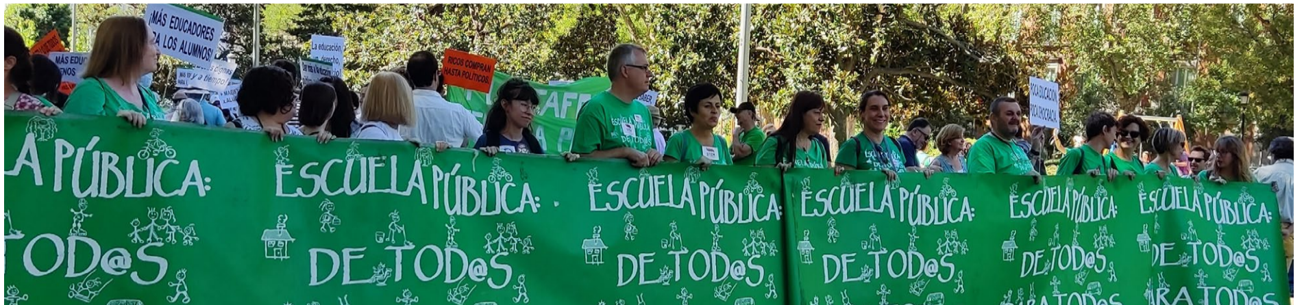
El 10 de septiembre, la Marea Verde convocó a miles de personas en una manifestación en Madrid contra la política educativa del Gobierno del PP

Más de 33.000 jóvenes no consiguen una plaza pública en los estudios de Formación Profesional de Grado Medio y Superior en nuestra Comunidad, en la primera fase de matriculación que se produjo durante el mes de julio. Por lo que esta falta de plazas se ha ido incrementando en los últimos años, ya que el curso pasado fueron 25.000 estudiantes los que se quedaron fuera del sistema educativo público.