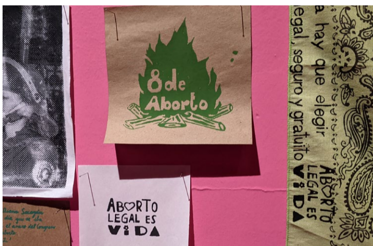
Exposición Giro gráfico. Como en el muro la hiedra, Museo Reina Sofía 2022

cología se ha declarado objeto de conciencia. La objeción siempre se realiza de manera tácita, se da por hecho, no se exige ninguna firma ni documento oficial, a pesar de que todos tenemos derecho a conocer si nuestros médicos son objetores.